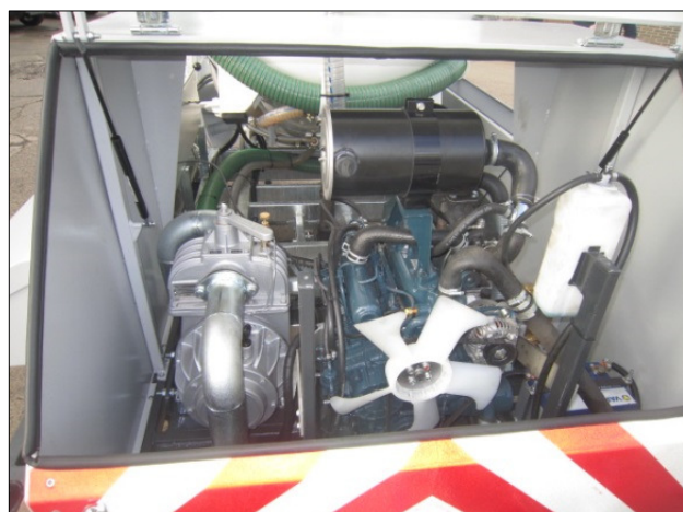
Motor Kubota D 1105T – 33cv

Slib compartiment : 1200 liter Water compartiment : 500 liter zijdelings verspreid voor een betere stabiliteit